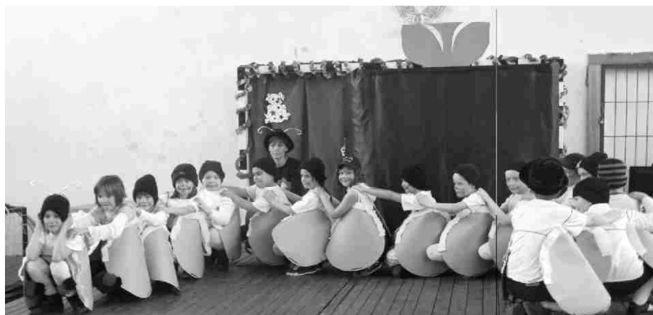
A harminclábúak (2. b)

közmondásokat, szólásokat adott elő, mindannyiunk tanulságára, a 3. b pedig élő sakkjátszmát mutatott be. A 4. a színes hernyóként tekeregett előttünk, s végül a 4. b-s robotok lázadását láthattuk. Ezt követően megcsodálhattunk számtalan ötletes jelmezt: volt köztük tündér, angyal, boszorkány, lovag, kalóz, és voltak mesehősök, érdekes növények és vadállatok. Amíg a zsűri visszavonult döntéshozatalra, mi táncolhattunk Hutter Anett néptáncosaival