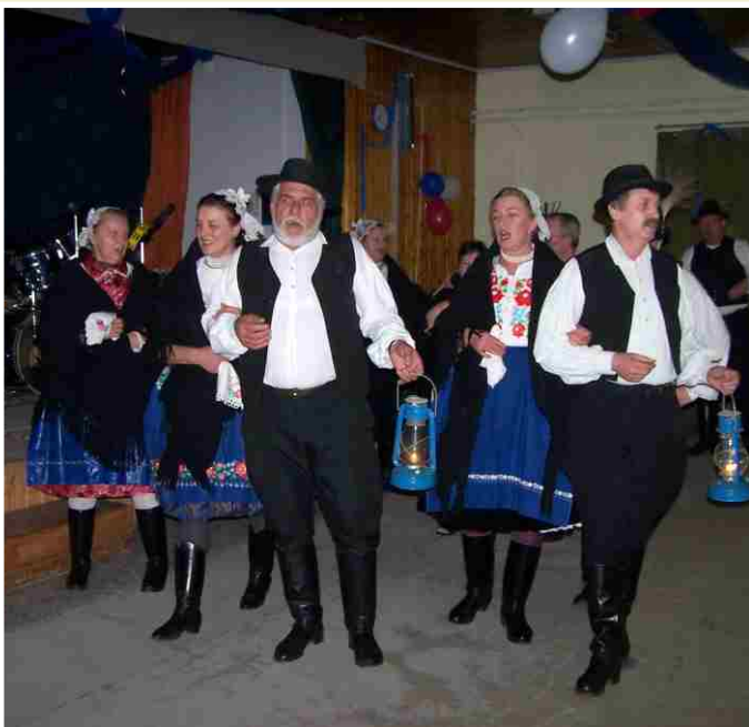
István-napi köszöntő a Hagyományörző Csoport előadásában