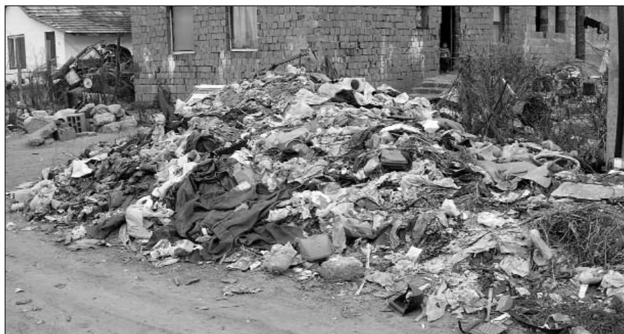
Az önkormányzati beavatkozásnak köszönhetően most már nem látni ilyen szeméthegeket