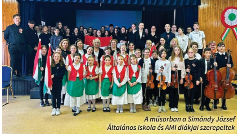
A műsorban a Simándy József Általános Iskola és AMI diákjai szerepeltek