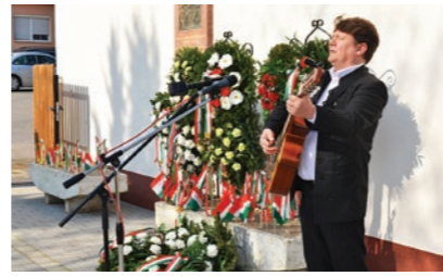
Szabó Gyula Győző előadóművész