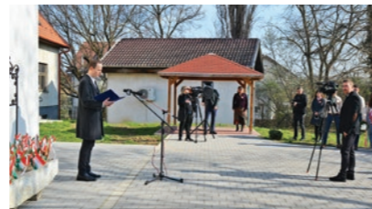
A Zarándokvezető-képző Központ udvarában koszorúztak

frakció, az MSZP helyi szervezete, a Demokratikus Koalíció helyi szervezete, a Kistarcsai Vállalkozók Baráti Köre, az Együtt Lehet Változás Egyesület, a Fenyvesliget Egyesület, a 918. Batthyány Cserkészcsapat, a Kistarcsai KÖFE Kft. és Kistarcsai VMSK Kft. helyezték el az emlékezés és a tisztelet virágait az emléktáblánál. A koszorúzási ünnepségre a Szózat közös elnéklésével ért véget.