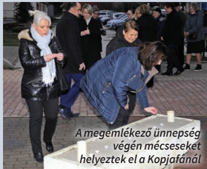
A megemlékező ünnepség végén mécseseket helyeztek el a Kopjafánál

A koszorúzást követően Szabó Gyula Győző előadóművész, Balázs Ferenc „Fenn az égen” című dalát énekelte el. A megemlékező ünnepség végén a megjelentek mécseseket gyújtottak.