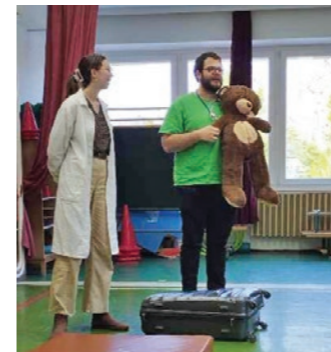
Teddy Maci Kórház doktorai

Óvodánkban sok évvel ezelőtt az óvónők közösen kidolgoztak egy óvodai egészségéhtprogramot. Legfontosabb célunk, hogy a gyermekek játékos módon sajátíthassák el az egészségünk védelmének alapjait.