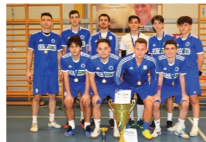
A kupát a Kistarcsai Utánpótlás csapat nyerte

A Sportközpont bejáratánál Győri István portréja előtt mécsesek és gyertyák jelezték a város együttérzését.