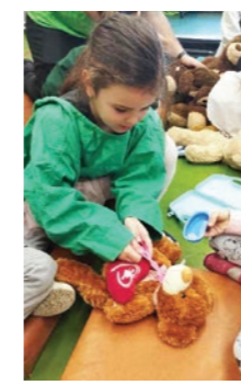
Az orvosok sikeresen gyógyítottak